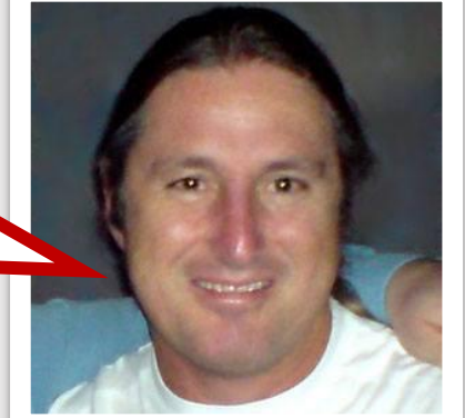
Tim Winton escritor y defensor del medio ambiente

La salud de nuestros mares determina el futuro de la humanidad.