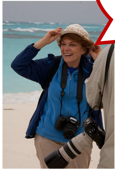
Dr Sylvia Earle bióloga marino y autora

Con cada gota de agua que bebes, con cada respiración que haces, estás conectado al mar. No importa en qué lugar de la Tierra vivas.