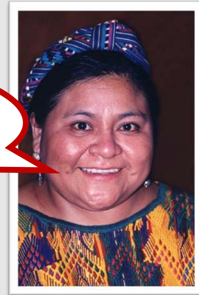
Rigoberta Menchu – líder indígena y activista guatemalteca

No desprecies las tradiciones que nos llegan de antaño; ocurre a menudo que las viejas guardan en la memoria cosas que los sabios de otro tiempo necesitaban saber.