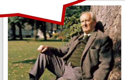
J.R.R. Tolkien – escritor

No desprecies las tradiciones que nos llegan de antaño; ocurre a menudo que las viejas guardan en la memoria cosas que los sabios de otro tiempo necesitaban saber.