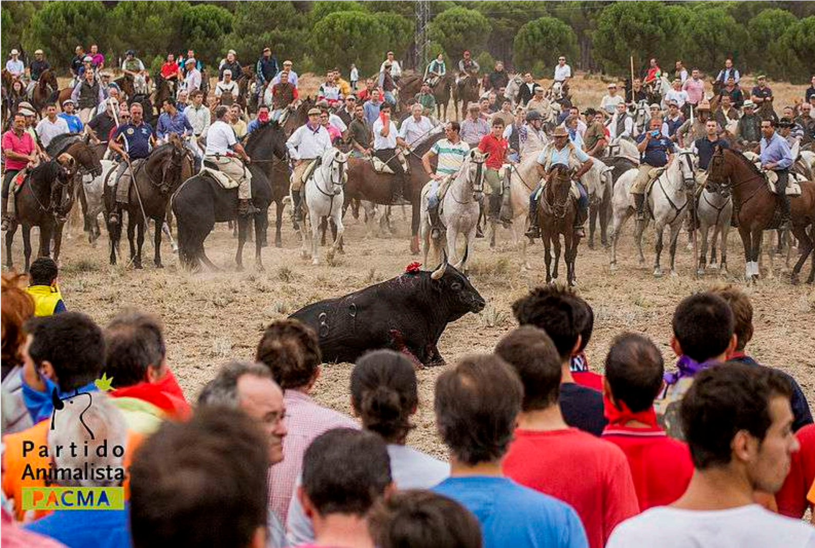
Imagen de Partido Animalista - PACMA - de España, CC BY-SA 2.0, via Wikimedia Commons