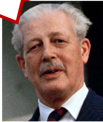
Harold Macmillan – Político Británico

Los indígenas estamos dispuestos a combinar tradición con modernidad, pero no a cualquier precio.