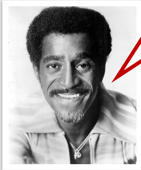
Sammy Davis Junior Cantante

Siempre tienes dos opciones: tu compromiso vs. tu miedo.