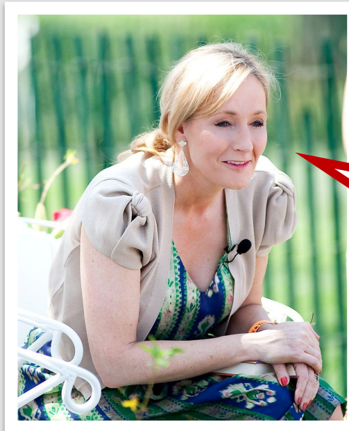
J.K. Rowling Autora, guionista, productora de cine y televisión

Son nuestras elecciones las que muestran lo que realmente somos, mucho más que nuestras capacidades.