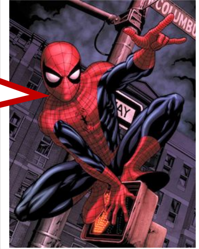
Spiderman Personaje de ficción, superhéroe y estudiante universitario

Un gran poder conlleva una gran responsabilidad.