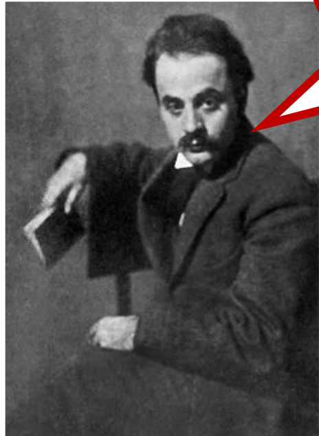
Khalil Gibran Escritor