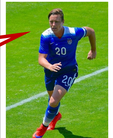
Abby Wambach Ganadora de la Copa del Mundo Femenina

Ni una sola vez he recorrido todo el campo ni he marcado un gol yo sola.