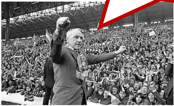
Bill Shankly Entrenador del Liverpool FC 1959- 1974

Algunos piensan que el fútbol es una cuestión de vida o muerte. Les aseguro que es mucho más serio que eso.