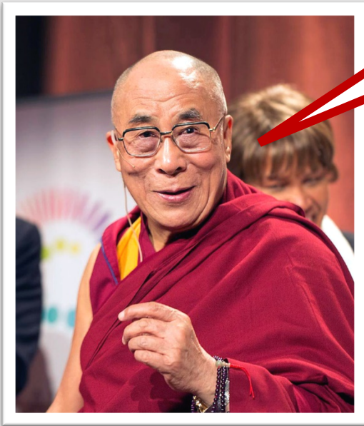
Dalai Lama budista