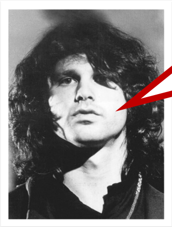
Jim Morrison cantor, compositor, poeta

Um amigo é alguém que te dá total liberdade para seres tu próprio.