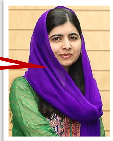
Malala Yousafzai Ativista paquistanesa

O meu pai sempre me disse: “Malala, serás livre que nem um pássaro.”