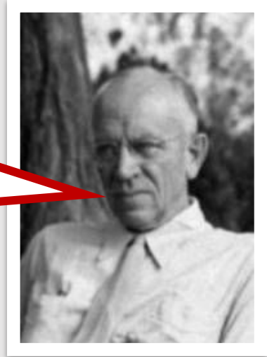
Aldo Leopold Científico, académico, escritor y filósofo

Cuando vemos la tierra como una comunidad a la que perteneceemos, podemos empezar a utilizarla con amor y respeto.