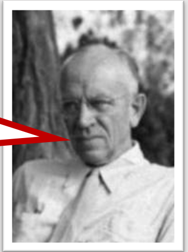
Aldo Leopold Cientista, escritor e filósofo

Quando consideramos que a terra é uma comunidade à qual pertencemos, talvez comecemos a fazer uso da terra com amor e respeito.