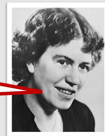
Margaret Mead Antropóloga de Nova Iorque

Uma das necessidades humanas mais antigas é ter alguém que pergunte onde estamos quando não voltamos para casa à noite.