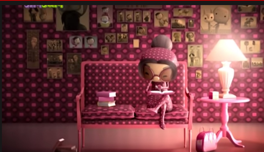
A Grande Descoberta Lar