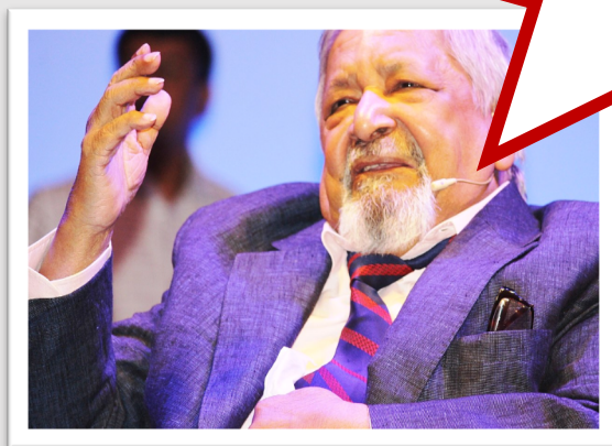
V. S. Naipaul Romancista de Trinidad

Suponho que casa é uma ideia de criança. Uma casa, à noite e uma luz nessa casa. Um sítio onde nos sentimos seguros