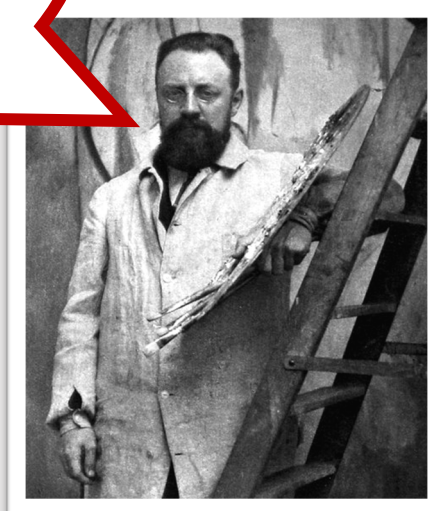
Henri Matisse Pintor francês

Não esperava recuperar da minha segunda cirurgia, mas já que recuperei considero que estou a viver um tempo que me foi emprestado. Cada dia novo é um presente para mim e é assim que o encaro.