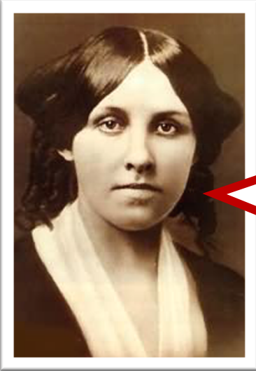
Louisa May Alcott Romancista dos Estados Unidos, Little Women

Não tenho nada para dar, a não ser um coração cheio e estas mãos vazias.