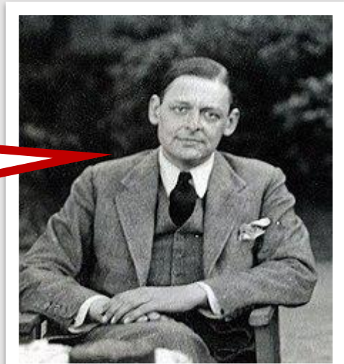
T.S. Eliot Poeta

En mi principio está mi fin... en mi fin está mi principio.