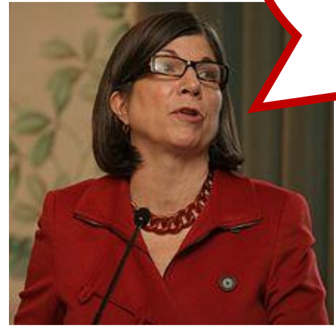
Anna Quindlen Periodista en el New York Times

La vida no consiste tanto en principios y finales como en seguir y seguir y seguir. Se trata de ir por el medio.