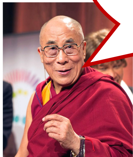
#14 Dalai Lama Tenzin Gyatso líder religioso

Amor, bondade, compaixão e tolerância são qualidades comuns a todas as religiões e quer sigamos ou não uma tradição religiosa em particular, os benefícios do amor e da bondade são óbvios para todos.