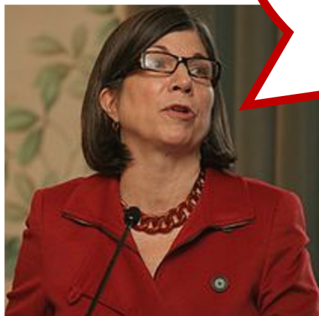
Anna Quindlen jornalista, New York Times

A vida não é tanto sobre começos e fins, mas sobre continuar, continuar e continuar. Trata-se daquilo que se faz pelo meio.