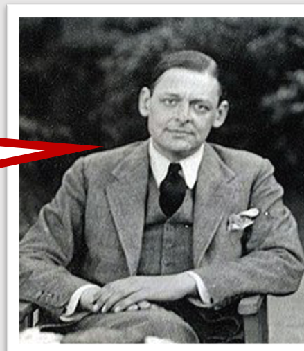
T.S. Eliot poeta

No meu começo encontra-se o meu fim... no meu fim encontra-se o meu começo.