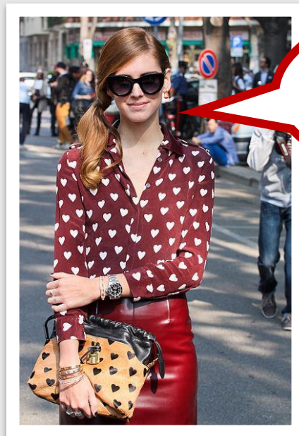
Chiara Ferragni diseñadora de moda, influencer y empresaria

Estaba muy orgullosa de mi equipo y de mí misma por haber cambiado las reglas de la industria de la moda.