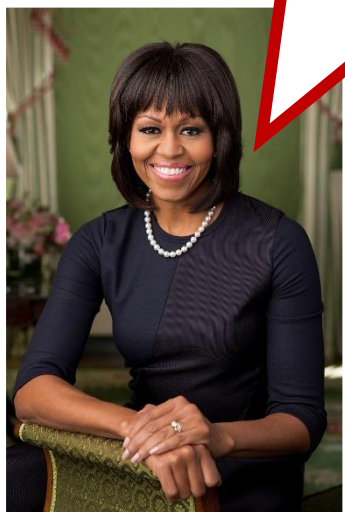
Michelle Obama Abogada y escritora

Lo único que tenemos que decidir es qué hacer con el tiempo que se nos da.