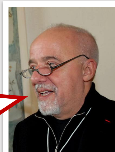
Paulo Coelho Autor y escritor