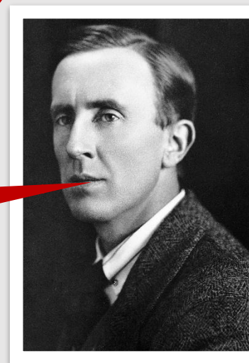
J.R.R. Tolkien Escritor