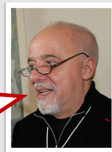
Paulo Coelho compositor e escrito