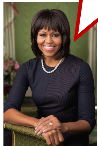
Michelle Obama advogada e escritora

Não podemos tomar decisões baseados no medo ou naquilo que eventualmente pode acontecer.