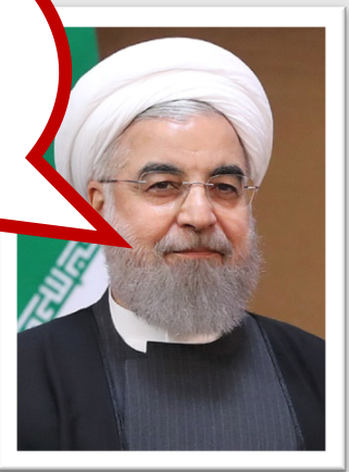
Hassan Rouhani presidente do Irão 2013-2021

A globalização mostrou que durante crise global estamos todos no mesmo barco.