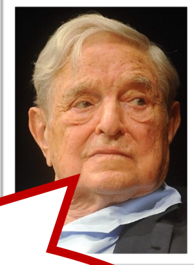
George Soros investidor e filantropo

A globalização tornou o mundo cada vez mais interdependente, mas a política internacional ainda se baseia na soberania dos Estados.