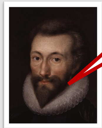
John Donne poeta renascentista