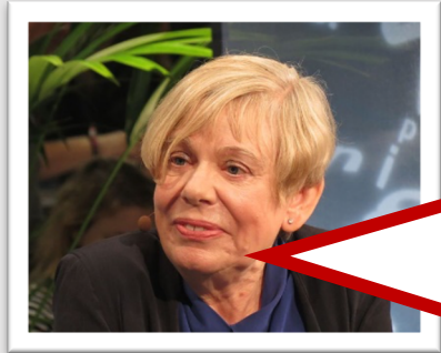
Karen Armstrong escritora

Podemos enfatizar os aspetos das nossas tradições, religiosas ou seculares, que falam de ódio, de exclusão e de suspeita, ou trabalhar com aqueles que enfatizam a interdependência e a igualdade de todos os seres humanos. A escolha é sua.