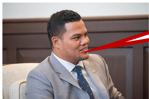
Simon Kofe Ministro de Asuntos Exteriores de Tuvalu, en la cumbre del clima COP26

No podemos esperar a los discursos, cuando el mar está subiendo a nuestro alrededor todo el tiempo.