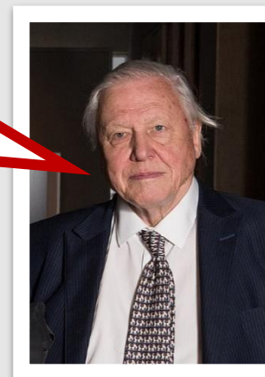
David Attenborough Documentalista

Sin duda, trabajando juntos, somos lo suficientemente poderosos para salvar nuestro planeta.