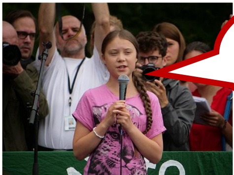
Greta Thunberg Activista climático

Quiero que actuéis como lo harías en una crisis. Quiero que actúes como si nuestra casa estuviera en llamas. Porque lo está.