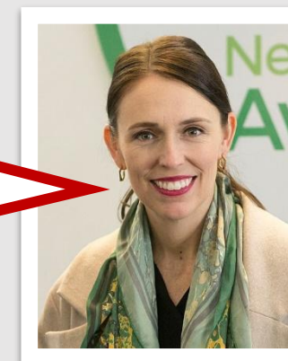
Jacinda Ardern Primera Ministra de Nueva Zelanda

Se pueden ver los fenómenos meteorológicos extremos que estamos experimentando como resultado del calentamiento del clima.