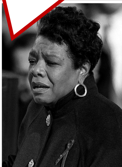
Maya Angelou poeta e activista

Sonhei que caminhávamos juntos pela praia. Conversámos e rimos. Esta manhã encontrei areia no meu sapato e uma concha no meu bolso. Estava mesmo só a sonhar?