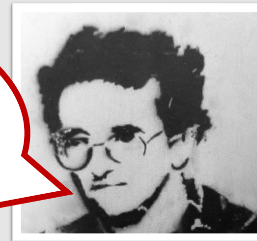
Roberto Bolaño autor romance 2666

Ler é como pensar, como rezar, como conversar com um amigo, como dizer o que pensamos, como ouvir as ideias dos outros, como ouvir música (oh sim), como admirar a paisagem, como um passeio na praia.