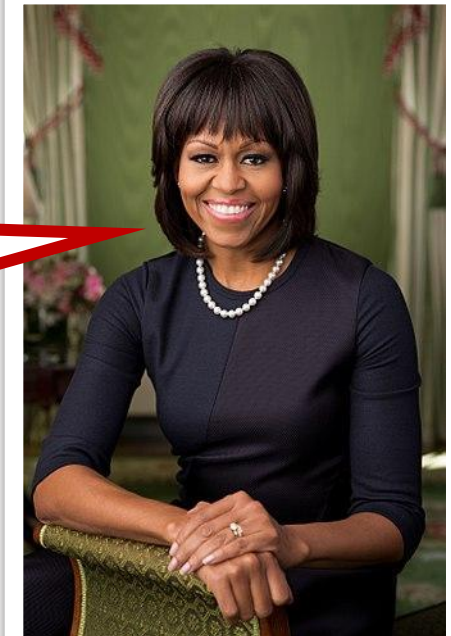
Michelle Obama Abogada y autora

El éxito no tiene que ver con el dinero que ganas, sino con la diferencia que marcas en la vida de alguien.