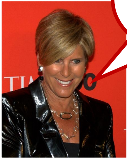
Suze Orman Autora y asesora financiero

Primero las personas, luego el dinero y después las cosas.