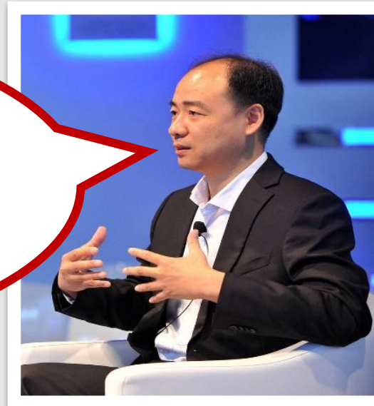
Ma Jun Ecologista

El reto medioambiental es tan grande que ningún organismo puede ocuparse de él por sí solo. Se necesita la colaboración de todas las partes interesadas: empresas, gobiernos, ONG y el público.