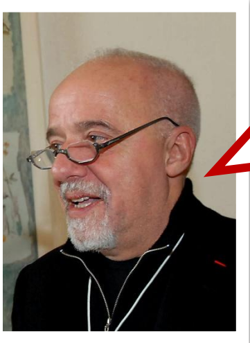
Paulo Coelho de Souza Novelista brasileño

Si eres lo suficientemente valiente para decir adiós, la vida te recompensará con un nuevo hola.