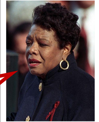
Maya Angelou autora y activista de los derechos civiles

Todos los niños deberían crecer sintiéndose queridos y apoyados.