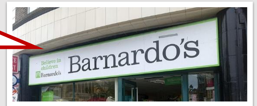
Barnardo's Organización benéfica para niños del Reino Unido